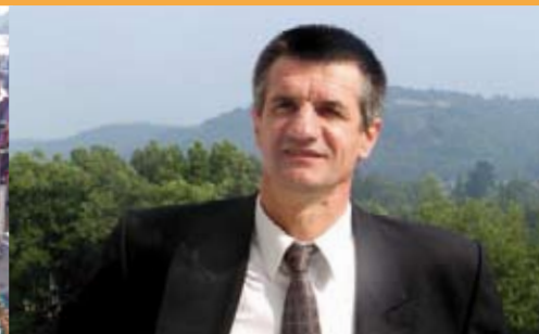
Devant "ses" montagnes