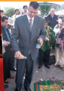
En mission internationale en Amérique du Sud

Jean Lassalle revendique son attachement aux valeurs fondamentales que sont la fidélité et l'amitié. Son histoire personnelle avec François Bayrou, l'ami de toujours, l'ami des bons et des moins bons moments, en est le parfait témoignage.