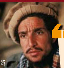
Le commandant Massoud

du « Se canto » entonné au cœur de l'hémicycle devant le Ministre de l'Intérieur pour faire entendre la voix des territoires français abandonnés par l'Etat. Ce sont enfin les 39 jours de grève de la faim contre la délocalisation de l'usine Toyal de la Vallée d'Aspe. Ce geste sans précédent aura démontré que le politique pouvait encore peser sur les décisions économiques qui déchirent notre tissu social.