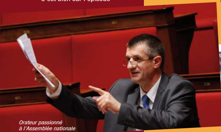
Orateur passionné à l'Assemblée nationale

Jean Lassalle est député des Pyrénées-Atlantiques depuis 2002. Il a été successivement membre de la prestigieuse commission des finances, puis de la toute nouvelle commission du développement durable et de l'aménagement du territoire. Il s'est fait connaître au niveau national pour ses actions iconoclastes à l'Assemblée. C'est bien sûr l'épisode